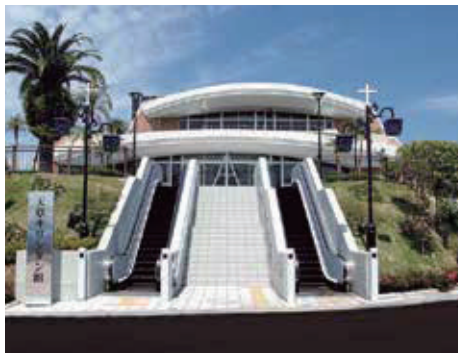
天草キリシタン館