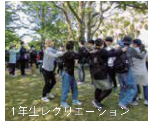
1年生レクリエーション