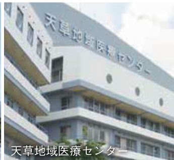
天草地域医療センター