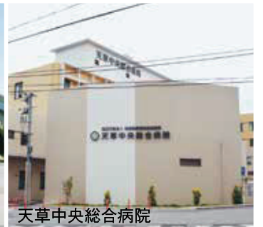
天草中央総合病院